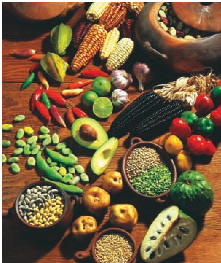
El aprovechamiento de productos nativos para la producción de nuevos alimentos se analizará en el evento.

Del 5 al 7 de noviembre, en las instalaciones de la UTPL, se desarrollará el II Congreso Ecuatoriano de Ingeniería en Alimentos y XI Jornadas de Ciencia y Tecnología en Alimentos. Este evento, organizado por la Escuela de Industrias Agropecuarias, el Centro de Transferencia de Tecnología e Investigación Agroindustrial CETTIA y el CITTES de Lácteos de la Universidad, tiene como objetivo establecer vínculos entre empresa y Universidad, que permitan difundir y aprovechar los conocimientos científicos y tecnológicos que ambas partes generan, para potenciar el desarrollo del sector agroalimentario.