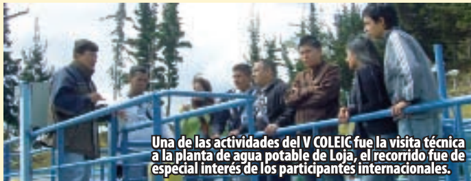
Una de las actividades del V COLEIC fue la visita técnica a la planta de agua potable de Loja, el recorrido fue de especial interés de los participantes internacionales.