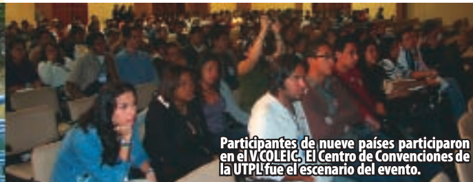
Participantes de nueve países participaron en el V COLEIC. El Centro de Convenciones de la UTPL fue el escenario del evento.