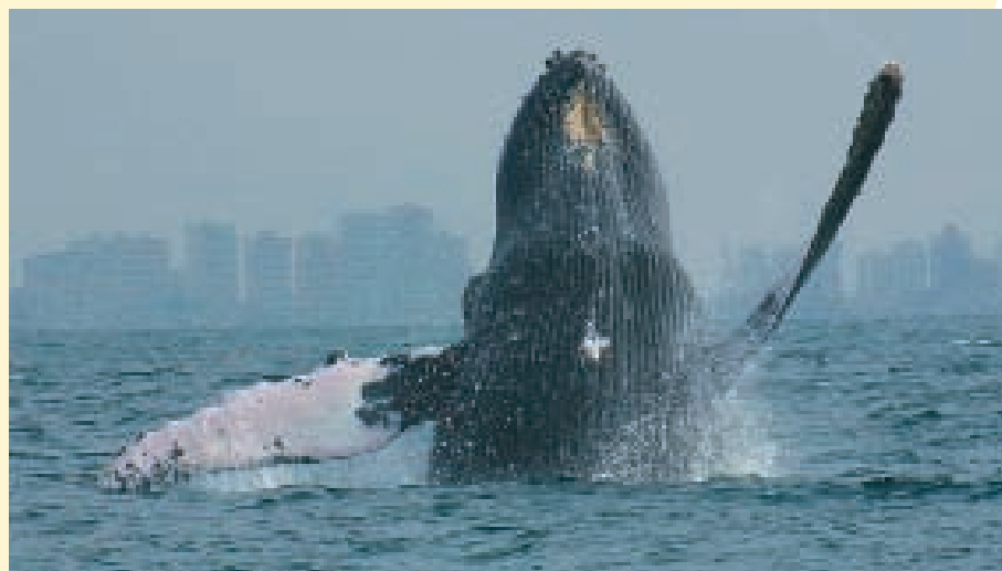
La Ballena Jorobada es uno de los atractivos a promocionar.