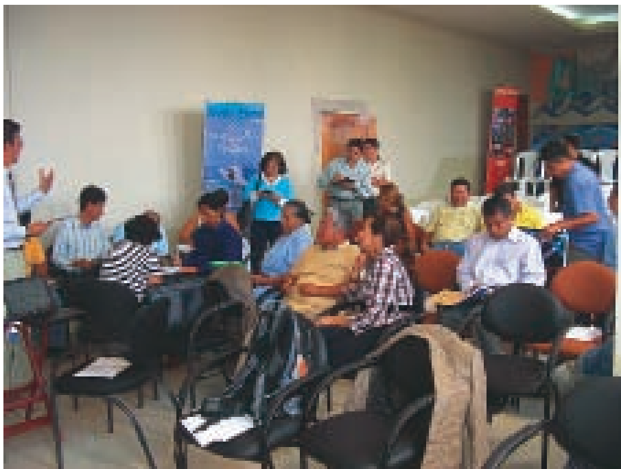
Se desarrollaron varios talleres entre los involucrados.

La Ruta de Spóndylus es una marca de productos y destinos de excelencia, sostenibilidad, solidaridad y cultura ecuatoriana, los encontramos a lo largo de la travesía histórica de las conchas mullas de la costa que va desde Ecuador hasta Perú. La Ruta es una iniciativa del Ministerio de Turismo y las Provincias de Esmeraldas, Manabí, Santa Elena, Guayas, El Oro y Loja, dentro del marco del Plan Estratégico de Desarrollo de Turismo Sostenible en Ecuador hacia el año 2020 – PLANDETUR 2020.