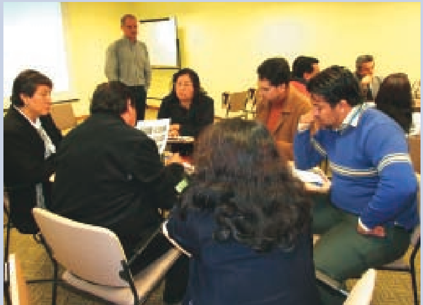
En mayo se realizó la primera capacitación en la UTPL