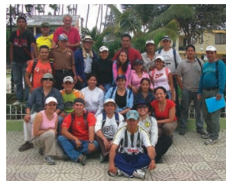
Todos los participantes en la capacitación.

El turismo desarrollado por comunidades es una actividad relativamente nueva en el país, al igual que las iniciativas de desarrollo socioeconómico con pertinencia cultural, por esta razón, tanto organizaciones de base como gubernamentales y no gubernamentales, reconocen el turismo comunitario como una actividad basada en la naturaleza, la cultura ancestral y la equidad económica; que como tal depende de la calidad del ambiente y de la diversidad cultural que existe en cada una de las regiones. Requiriendo para su desarrollo un proceso de autogestión con objeto de ser la propia comunidad quien maneje sus recursos.