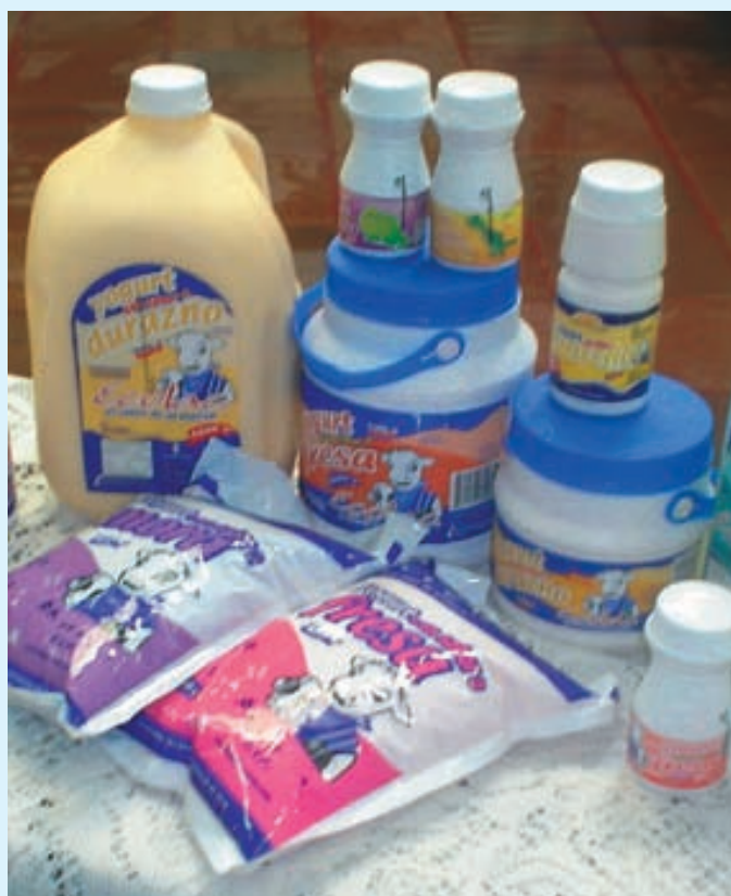
Lácteos de la UTPL presentes en Feria Ciudadana