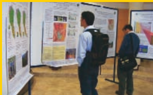
Alrededor de 40 posters se presentaron durante el simposio.