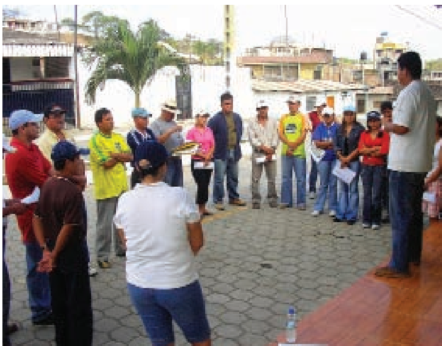
Durante la capacitación de los guías.

Es por esta razón que con el soporte técnico, científico y académico del Centro de Investigaciones Turísticas, CEITUR de la Universidad Técnica Particular de Loja (como Institución educativa legalmente constituida que desarrolla programas de capacitación formal y no formal enmarcadas en sus líneas de desarrollo institucional y que tiene como prioritario el Desarrollo Social y Comunitario de nuestra región y provincia) con el auspicio del H. Consejo Provincial de Loja a través de la Unidad de Turismo desarrolló un programa de formación de “Guías Nativos”.