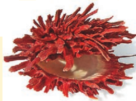
Esta es la concha que lleva por nombre Spóndylus.