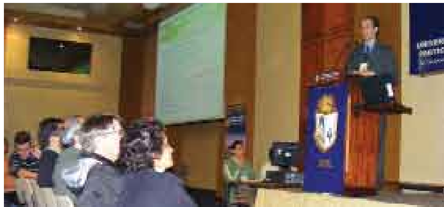
Empresa, universidad y estudiantes discutieron desarrollo del sector agroindustrial.