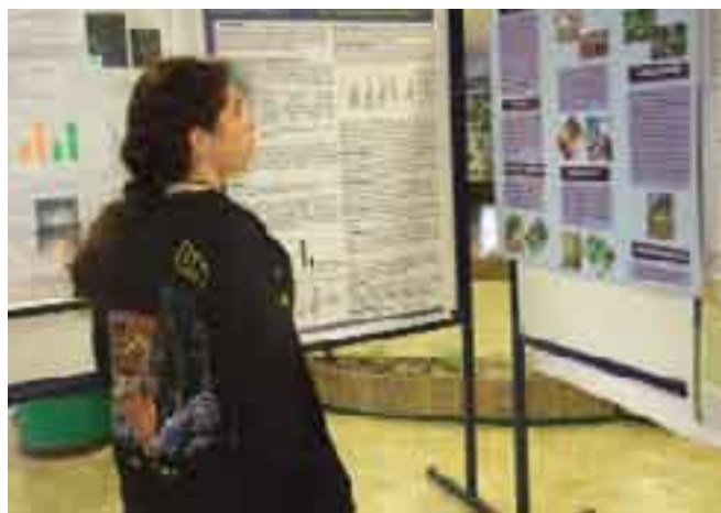
Estudiantes asistieron a exposiciones de papers.

En este sentido expresó que las especies más abundantes que se encuentran asociadas a la pesca atunera son: Canthidermis maculatus (chanchito), Coryphaena hippurus (dorado) y Acanthocybium solandri (wahoo), concluyó.