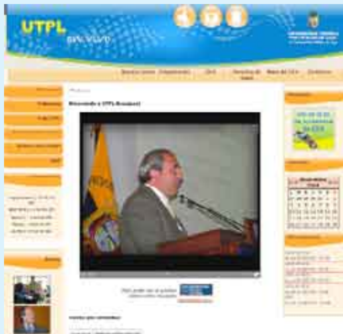
Canal de eventos UTPL en vivo