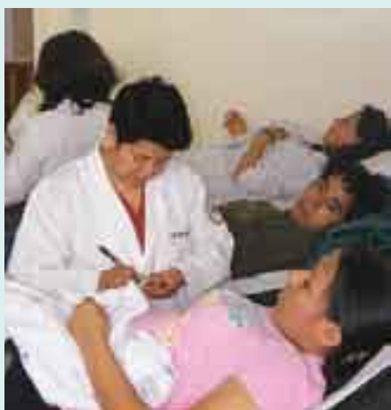
Se recaudaron 100 pintas de sangre.