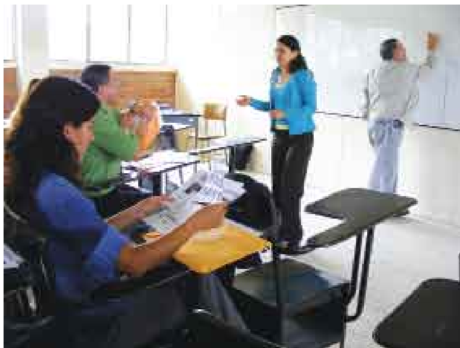
340 estudiantes de Pregrado fueron parte del LV Seminario de Fin de Carrera Docente