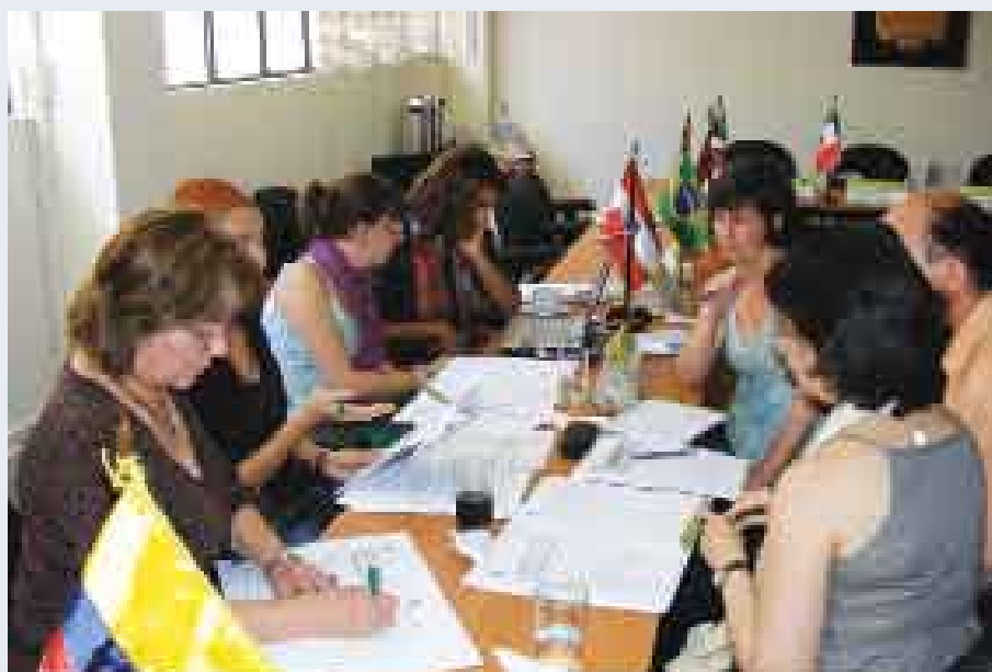
Cuarta reunión Inter-Alfa en la UTPL.