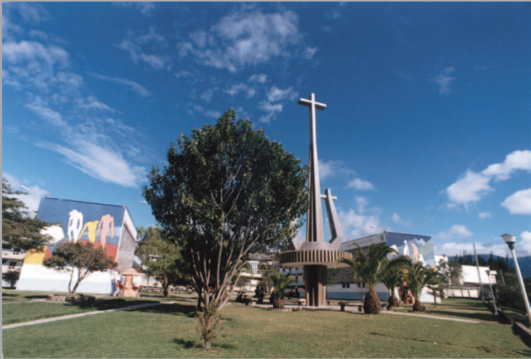
CAMPUS UNIVERSITARIO - SEDE CENTRAL LOJA - ECUADOR