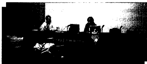
Presentación del seminario “Gestión del conocimiento y Web 2.0”.