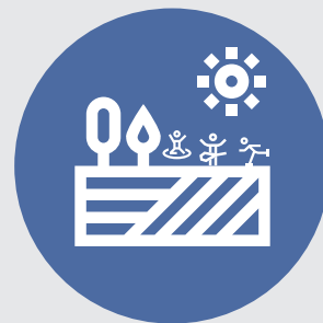
PATRIMONIO NATURAL Y CULTURAL

Es una orientación estratégica adoptada por el Estado en diferentes escalas o niveles de gobierno que busca resolver un problema de interés público con una visión de mediano y largo plazo, con un enfoque sistémico y multidimensional, buscando impactos simultáneos en las 5 dimensiones del desarrollo sostenible: económica, social, ambiental, político-institucional y cultural. Requieren de coordinación intersectorial y multiescalar, de alianzas estratégicas y de la participación activa de los distintos actores de la sociedad en todo el ciclo de la política.