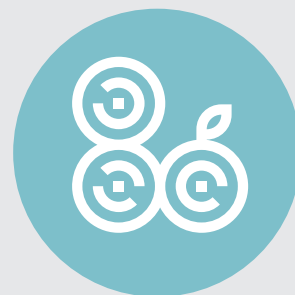
HUB DE CONECTIVIDAD FÍSICA Y DIGITAL