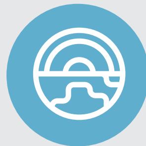
TURISMO, INDUSTRIAS CREATIVAS Y DEL OCIO