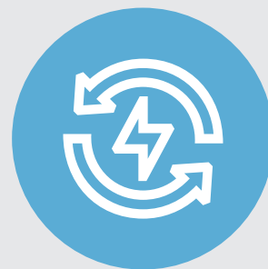
EMPRENDIMIENTO SOCIAL Y CON BASE TECNOLÓGICA